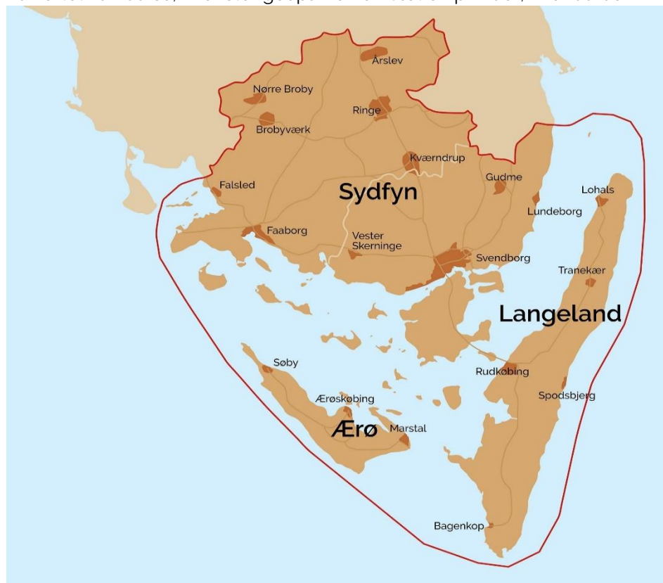
Kort over Geopark Det sydfynske Øhav: Udarbejdet af Geopark Det Sydfynske Øhav, sekretariatet

På kortet kan du se, hvor stor geoparken er. Sæt en prik der, hvor du bor.